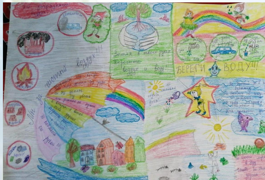
Участие в конкурсах рисунков «Берегите планету!» и «Город будущего»