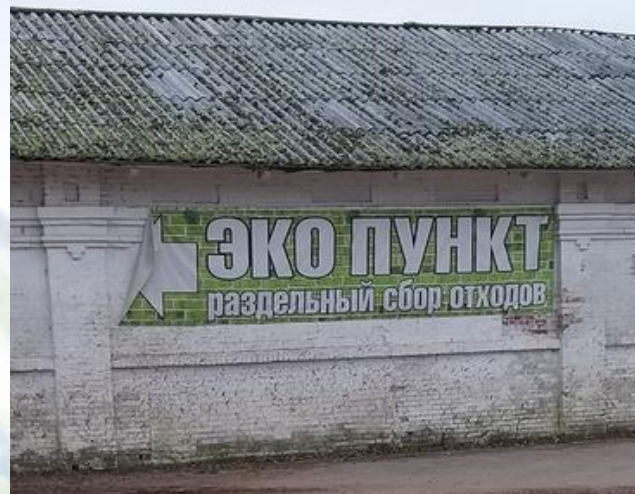
Эко пункт в пос. им. Дзержинского